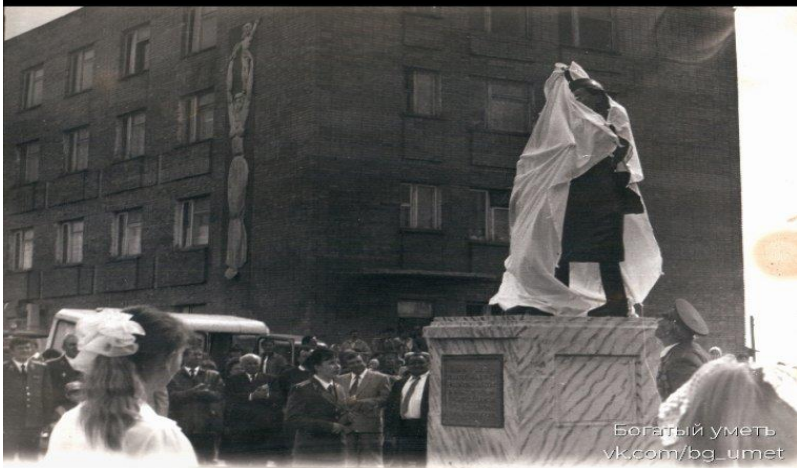
Богатый уметь vk.com/bg_ument

9 мая 1994 г., с. Богатое, Богатовская центральная районная больница.